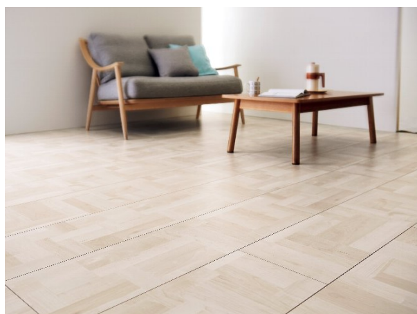
ブロックメイプル

※1. パーケットフロアとは…小さな板を寄せ集めて張ったフロアで、「寄木張りフロア」とも呼ばれています。デザイン性が高く、個性的なインテリアに仕上げることができます。