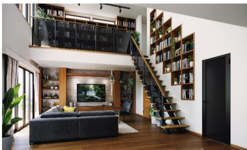
◆AMiS 樹脂パネル カラー：グレー

またこれまで、本体色によって対応できない樹脂パネルの組み合わせがありました。今後は、開口部商品「室内引戸」「室内ドア」「収納引戸」「収納折戸」「収納開き戸」「固定パーテーション」の樹脂パネルの設定を統一し、全ての本体色と樹脂パネルが自由に組み合わせ可能となりました。