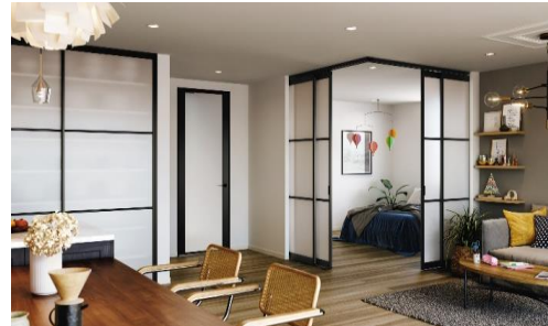
◆AMiS 本体・枠 カラー：ブラック

室内ドアや室内引戸、階段・手すりなどのアルミ型材（本体・枠）に、インテリアトレンドで人気の色「ブラック」を設定しました。