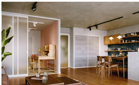
◆AMiS 本体・枠 カラー：ホワイト

これまで階段と手すりのみに設定していた「ホワイト」を、「室内ドア」「室内引戸」「収納引戸」「収納折戸」「収納開き戸」「固定パーテーション」にも追加することで、「AMiS」シリーズのトータルコーディネートが可能となりました。