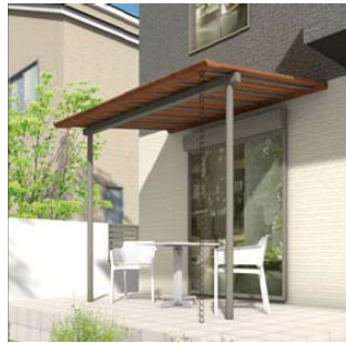
【参考イメージ： ジャラ細格子 アルミカラー タイプ】