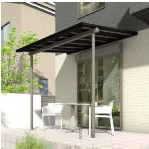
【参考イメージ： チャコールグレー アルミカラータイプ】

屋根材に使用されているエバーアートボードは両面ラッピング仕様なので、上から見てもキレイな仕上がりとなっております。