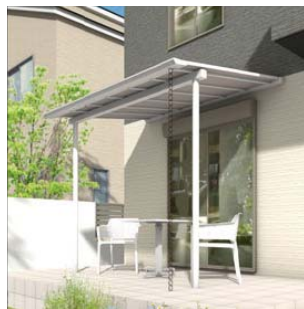
【参考イメージ： グレージュ ラッピングカラー タイプ】