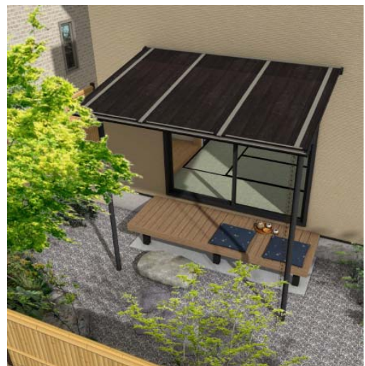
【参考イメージ： 墨板 ラッピングカラータイプ】