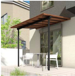
【参考イメージ： ジャラ細格子 ラッピングカラー タイプ】