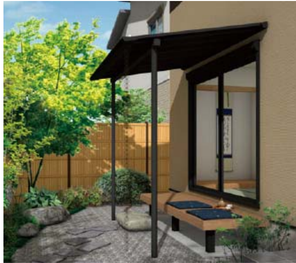
【参考イメージ：墨板 ラッピングカラータイプ】

ルーフは建物の意匠を極力そこなわないスリムでフラットなデザイン、柱はこだわりの円形で無駄のないキレイな仕上がりです。住まいのあらゆる空間で活躍する、新しい「軒のある生活」をご提案します。桁下寸法はH2500とH3000より選択可能です。