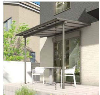
【参考イメージ： グレージュ アルミカラー タイプ】