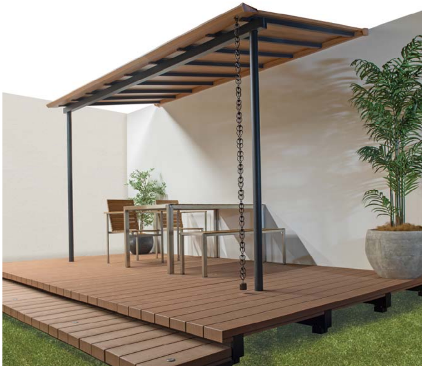
【参考イメージ：屋根材 ジャラ細格子 ラッピングカラータイプ】